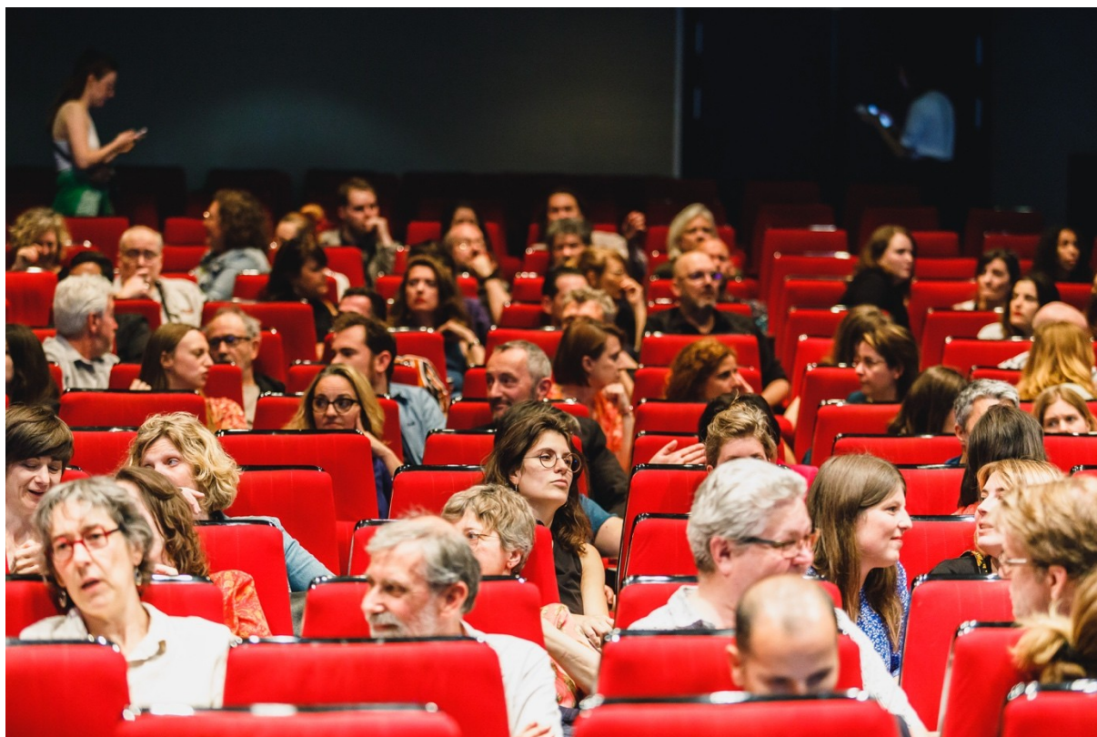
Édition 2023 © Rémi Poulverel